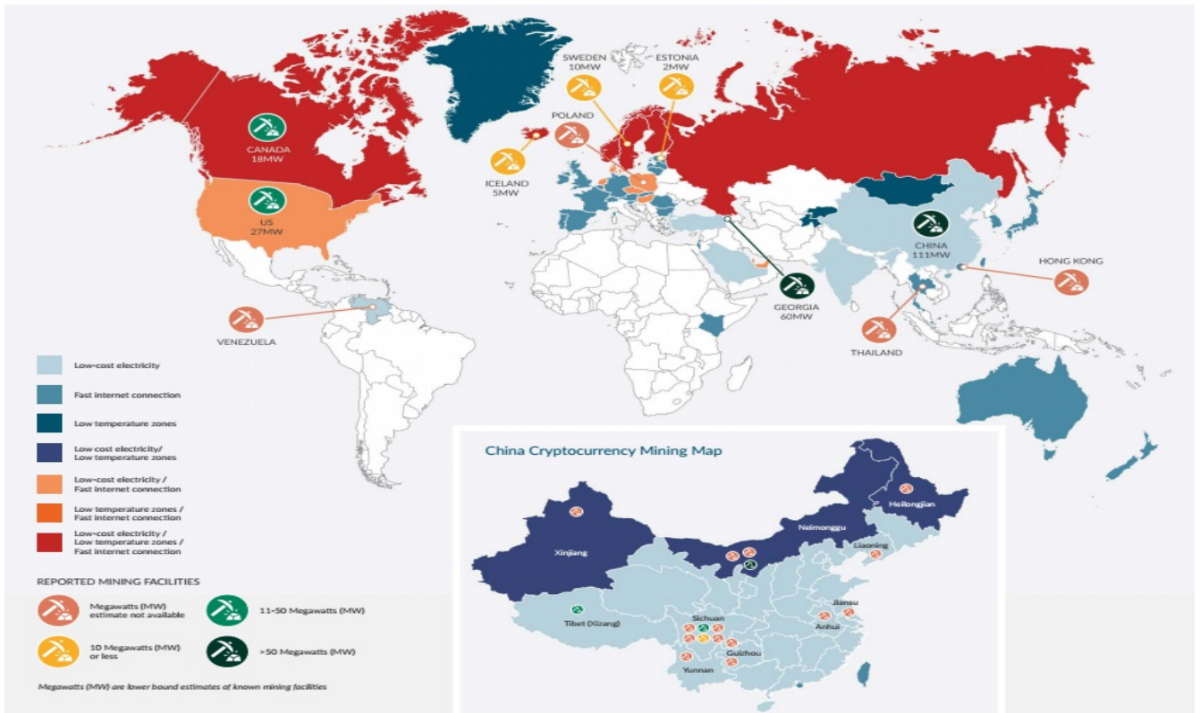
全球矿场分布图